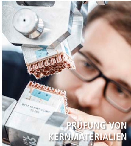
PRÜFUNG VON KERNMATERIALIEN