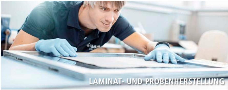
LAMINAT- UND PROBENHERSTELLUNG